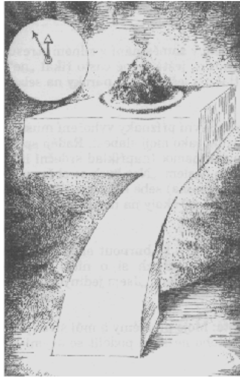
Obrázek, aneb jak se všech 7 bodů vypaluje..., vyhořuje....v hodině dvanácté Hennig-Keller (1996)